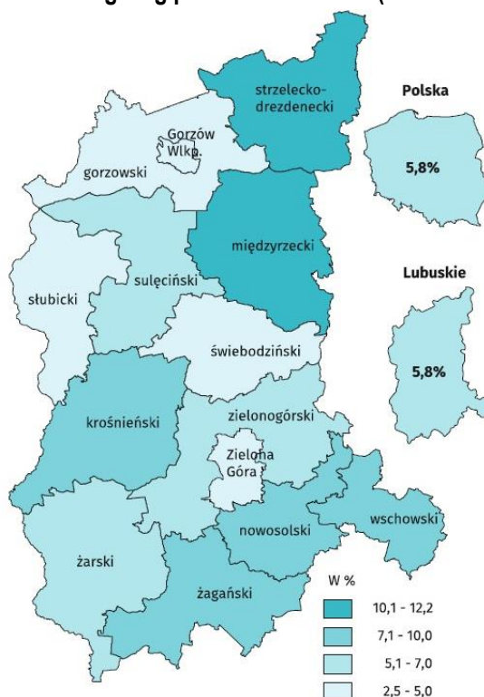
Ryc. 1. Stopa bezrobocia rejestrowanego wg powiatów w 2018 r. (stan na koniec XII)